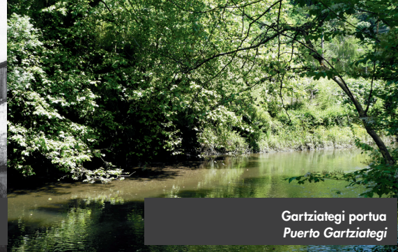
Gartziategi portua Puerto Gartziategi