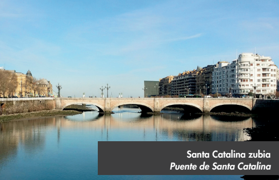
Santa Catalina zubia Puente de Santa Catalina