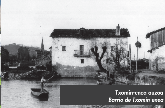
Txomin-enea auzoa Barrio de Txomin-enea