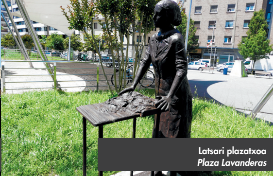
Latsari plazatxoa Plaza Lavanderas